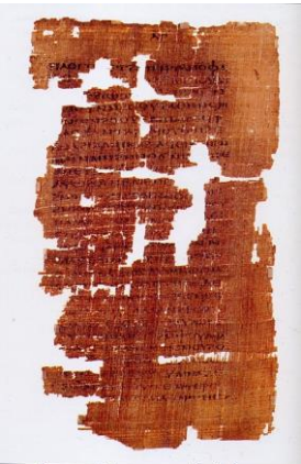
Ευαγγέλιο του Ιούδα