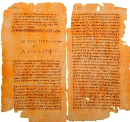
Απόκρυφα Ευαγγέλιο Ιωάννου

Μερικά από τα Γνωστικά κείμενα του Nag Hammadi, δεν έχουν στοιχεία από την χριστιανική παράδοση, αντλώντας την έμπνευσή τους από τα ιουδαϊκά κείμενα, και ιδίως την Παλαιά Διαθήκη, όπως άλλωστε και ο Χριστιανισμός. Πολλοί θεωρούν οξύμωρο αυτόν τον συνδυασμό Γνωστικισμού – Ιουδαϊσμού, ξεχνώντας ότι ακόμη ένας από τους πρώτους διάσημους Γνωστικούς, ο Σίμων ο Μάγος, ήταν Γνωστικός και Σαμαρείτης. Φυσικά τα λίγα που γνωρίζουμε για τους Ιουδαίους Γνωστικούς προέρχονται από τα κείμενα των πολεμίων τους, όπως συνέβαινε μέχρι τώρα και με τους Χριστιανούς Γνωστικούς.